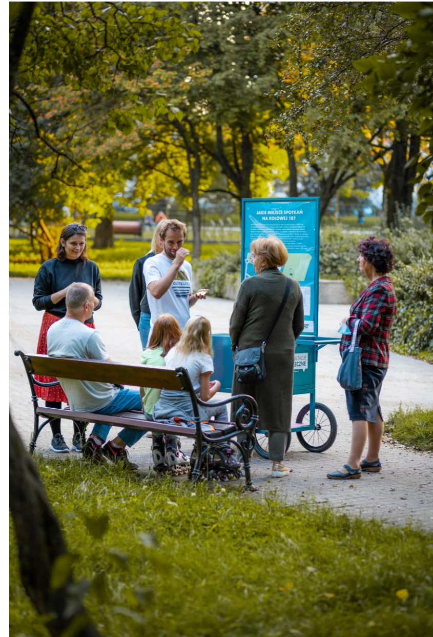
Mobilny punkt konsultacyjny w Parku Wiecha (13 września 2021)