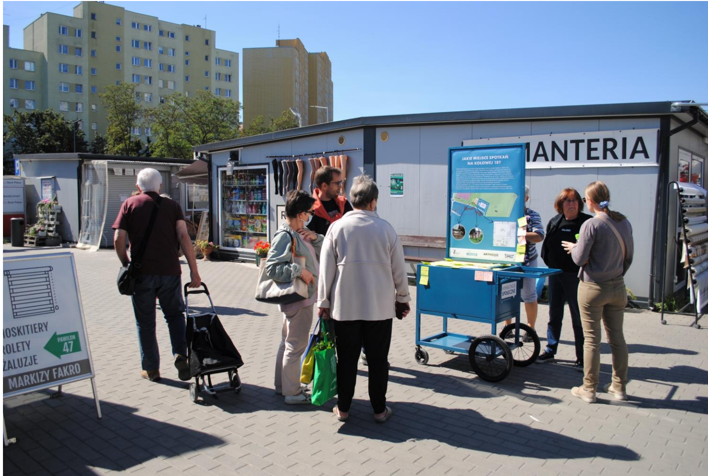
Mobilny punkt konsultacyjny na Bazarze przy Trockiej (6 września 2021)