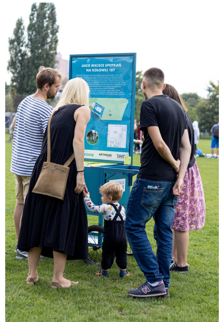
Punkt konsultacyjny podczas Garażówki Sąsiedzkiej (12 września 2021)