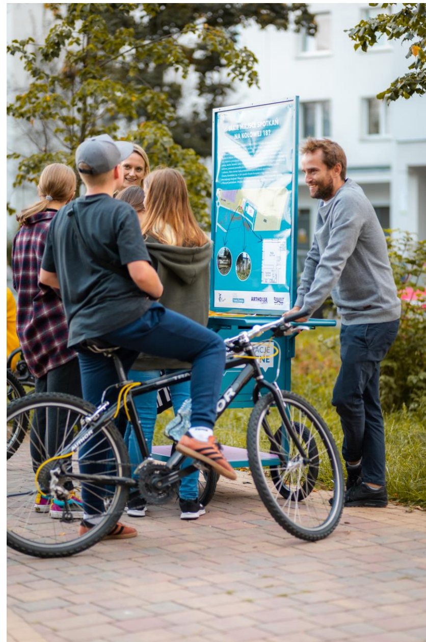
Rozmowa z młodzieżą podczas konsultacji w Parku Wiecha (13 września 2021)

Podczas mobilnych punktów konsultacyjnych rozmawialiśmy z ok. 192 mieszkańcami Targówka Mieszkaniowego. Podczas Garażówki Sąsiedzkiej swoimi uwagami podzieliło się z nami ok. 38 osób. W warsztacie wzięło udział 9 osób. Jedna osoba przesała nam uwagi drogą mailową. Łącznie w konsultacjach wzięło udział ok. 240 osób. Udało nam się dotrzeć do osób w różnym wieku – od dzieci, młodzieży, przez dorosłych po seniorów. Wśród osób, które brały udział w rozmowach o nowym miejscu spotkań na Targówku Mieszkaniowym, przeważały kobiety.