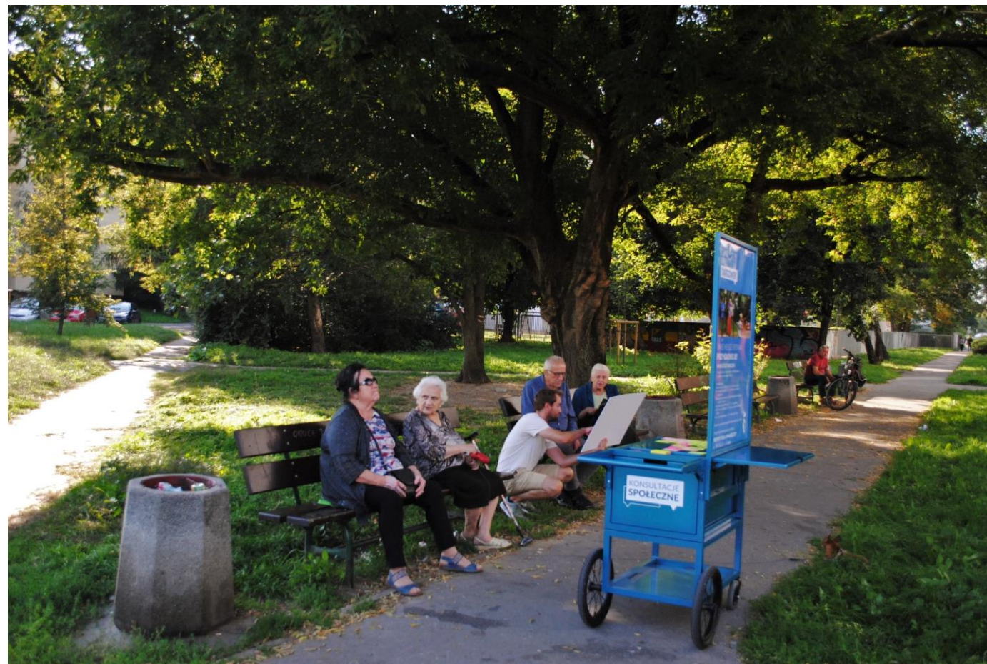
Rozmowy z seniorami na osiedlu (11 września 2021)