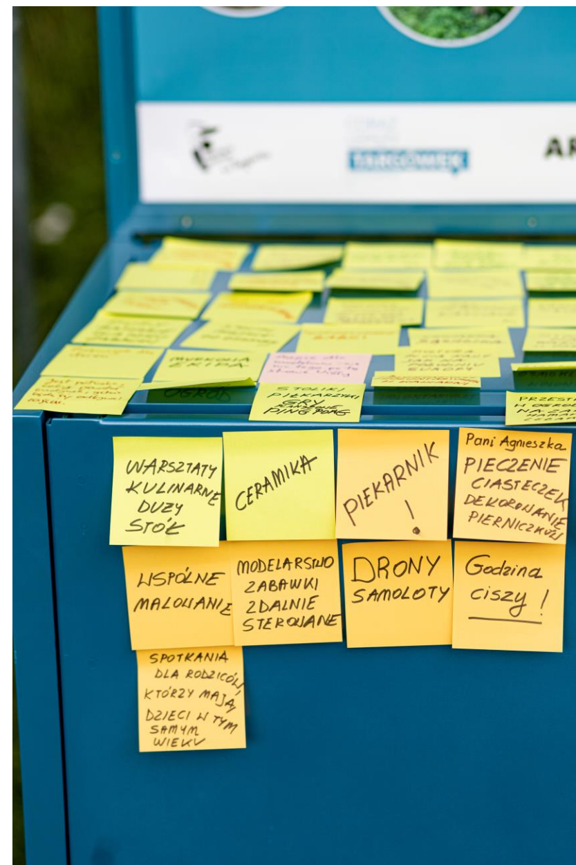
Pomysły mieszkańców zapisane na wózku konsultacyjnym (12 września 2021)