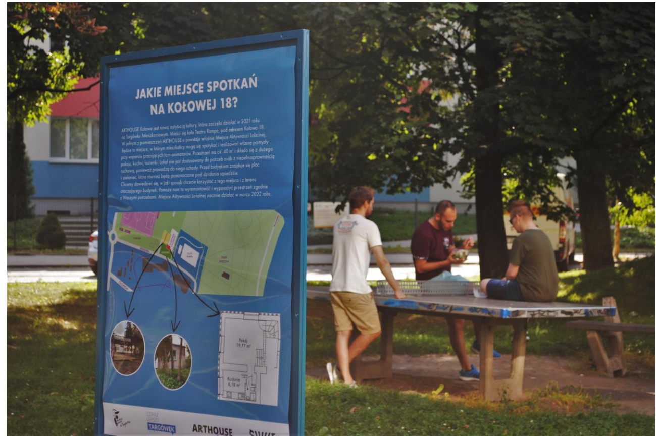
Rozmowy z mieszkańcami na osiedlu (11 września)

Bieżące informacje o MAL-u na Targówku Mieszkaniowym można śledzić na Facebooku Arthouse Kołowa.